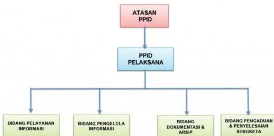
Gambar 1.1 Struktur layanan informasi dan dokumentasi pelaksana pada Dinas Kesehatan Aceh